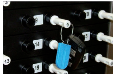
Abbildung zeigt den deponierten Schlüssel-Stecker