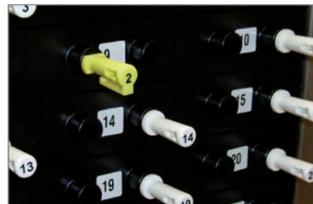
Abbildung zeigt den deponierten Bediener-Stecker