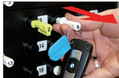
Entsperrten Schlüssel-Stecker entnehmen